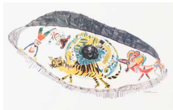
Detalj från utställningsaffisch, Moderna Museet. Förskolepedagogiken i Reggio Emilia var temat för två utställningar på 1980-talet.

Efter flera år som konstkritiker, främst på Dagens Nyheter, tar museerna över. Först Moderna Museet, från genombrottsåren med Pontus Hultén och popkonstnärer som Oldenburg och Warhol till tiden som chef och de stora utställningarna med Chagall, Matisse