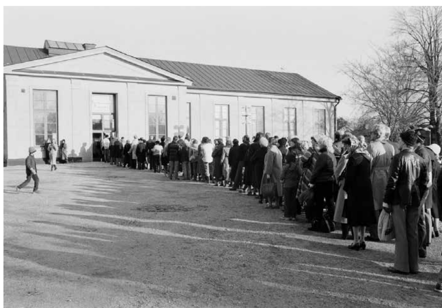
Carl Larssons »Midvinterblot« på Nationalmuseum. — Giorgio de Chirico, »Barnets hjärna«. Från Claes Oldenburgs utställning på Moderna Museet 1977. — Publikrusning till Chagallutställning 1982.

och Picasso. Sedan Nationalmuseum och posten som överintendent. Och den långa serien med utställningar fortsätter, med den stora Goyautställningen som en av höjdpunkterna. Hit hör förstås även historien om hur »Midvinterblot« slutligen hamnar på dess tänkta plats i museets trapphall.